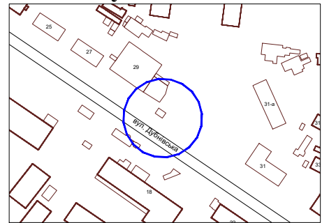
Схема розміщення тимчасової споруди, М 1:500