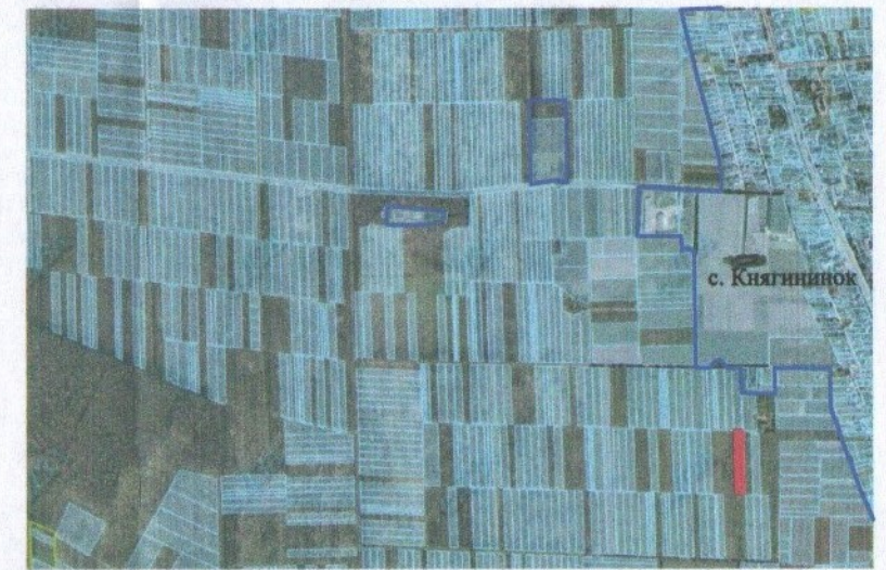
— - межа с. Княгининок