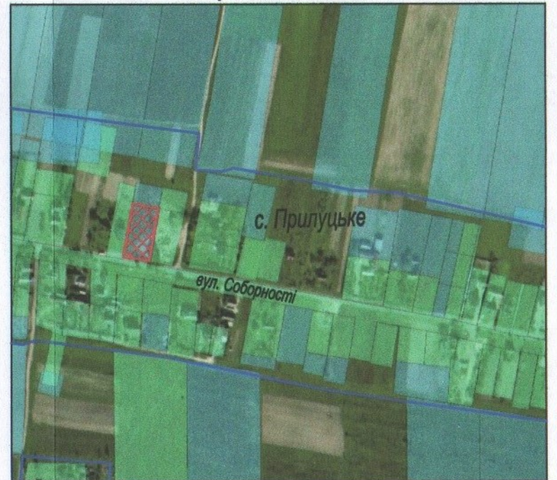
— межа с. Прилуцьке