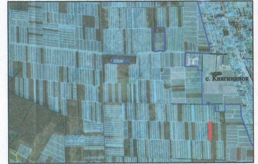
— - межа с. Княгининок