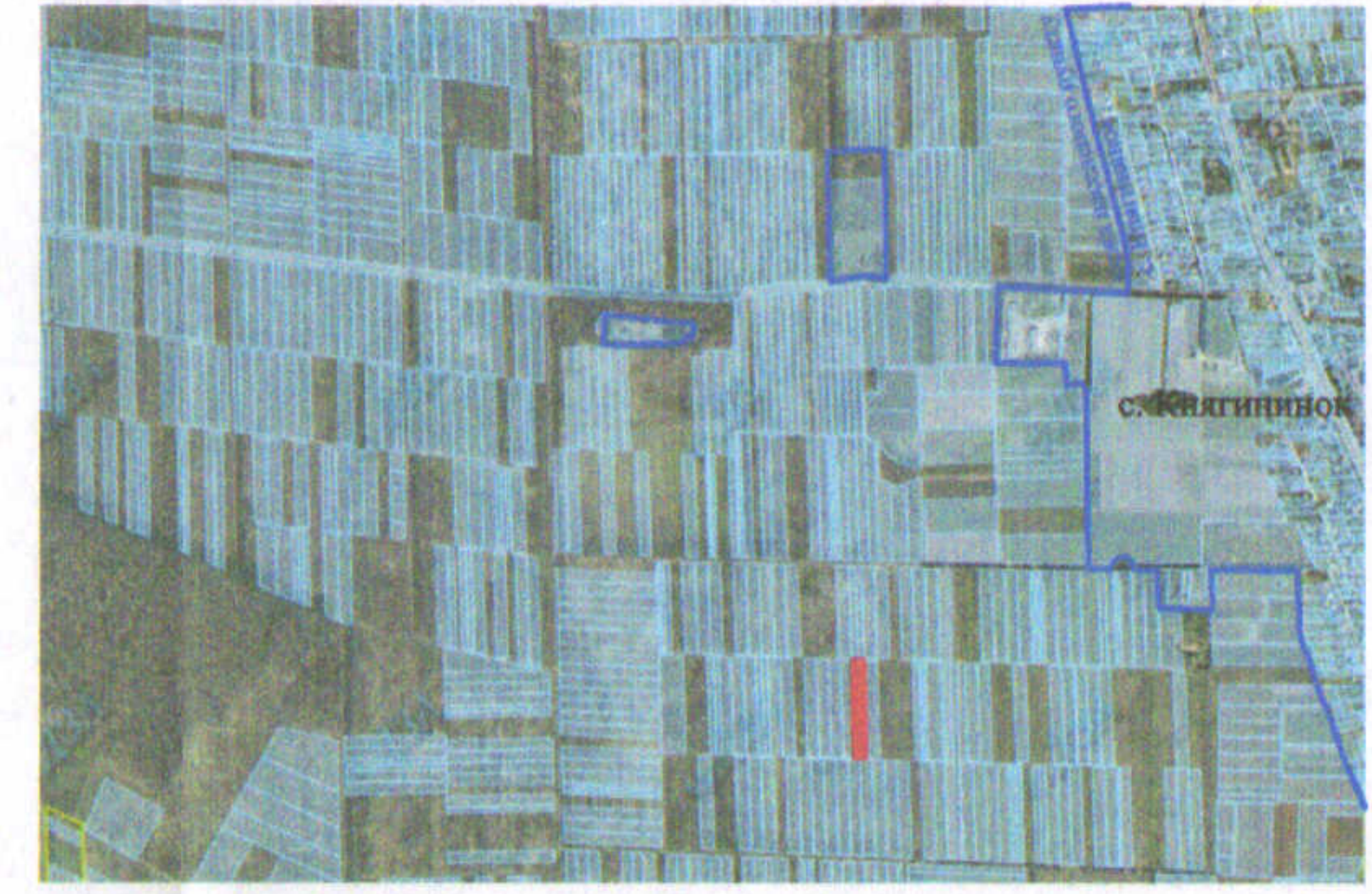
— - межа с. Княгининок