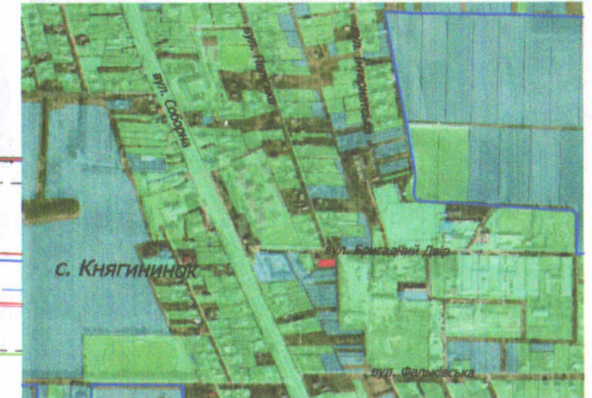
- межа с. Княгининок