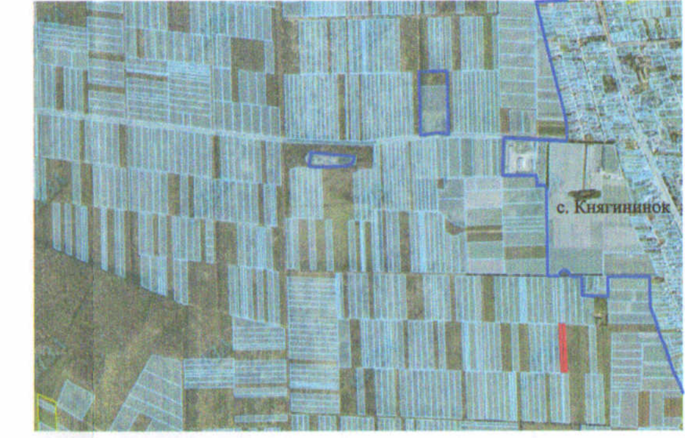
— - межа с. Княгининок