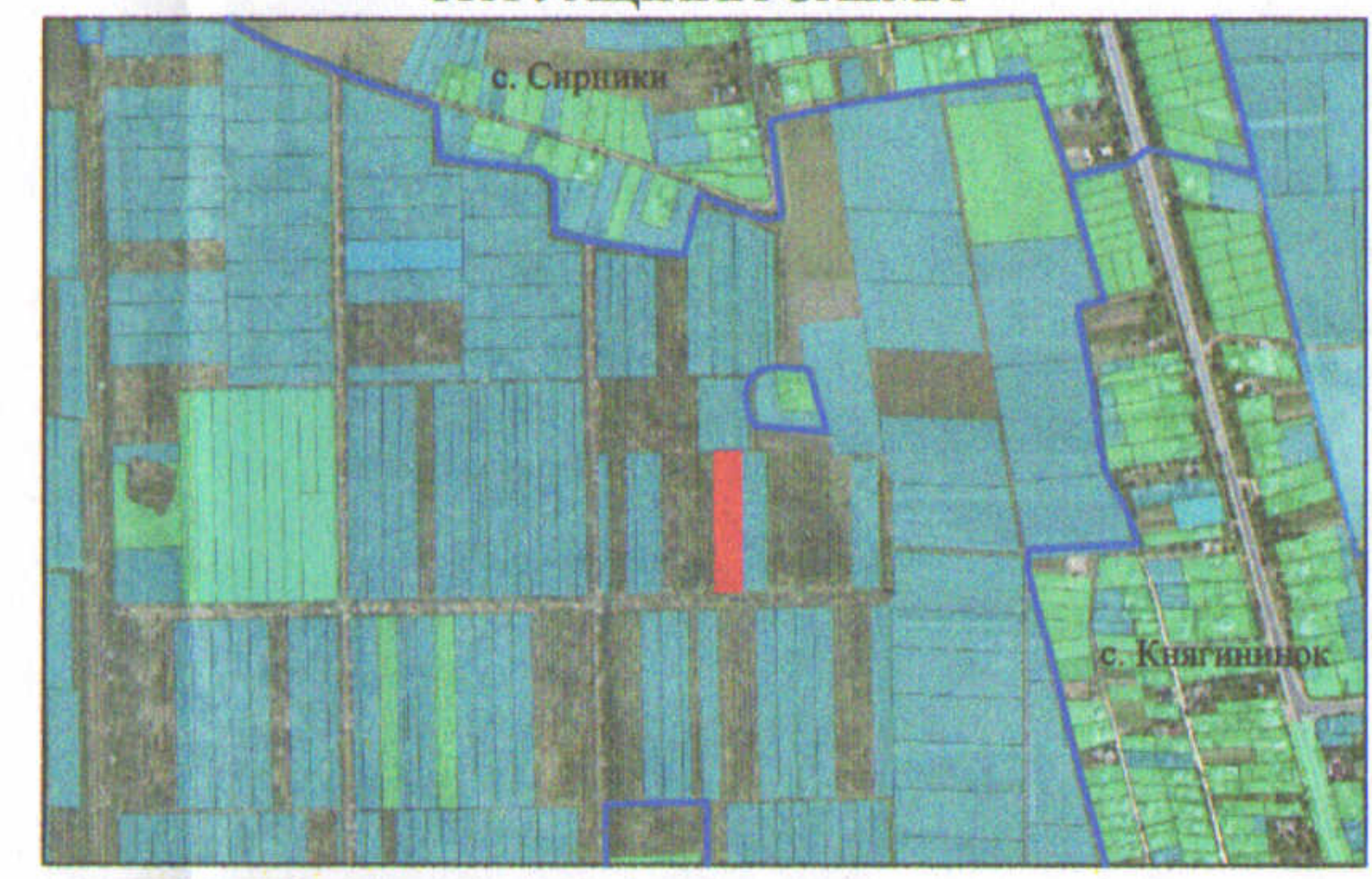
— - межа с. Княгининок, с. Сирники