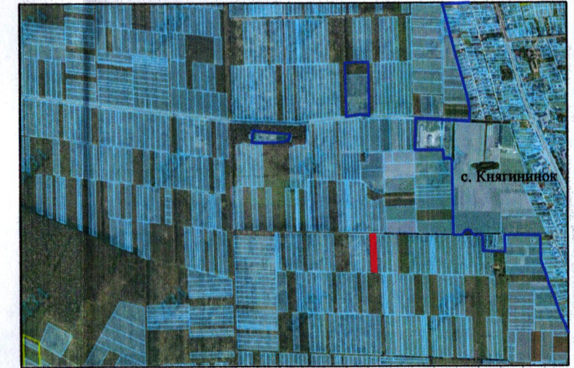
— - межа с. Княгининок