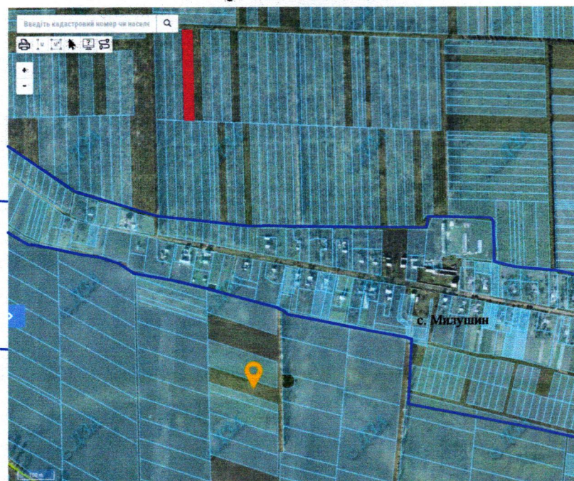
— межа с. Милушин