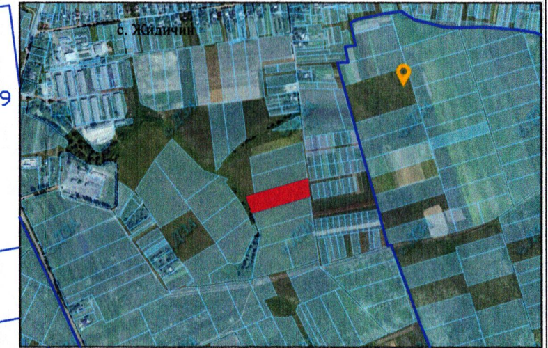
— - межа с. Жидичин