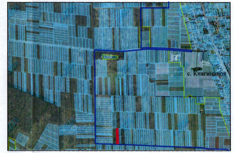
— - межа с. Княгининок

УМОВНІ ПОЗНАЧЕННЯ 0,6175 га — виділення в натурі (на місцевості) земельної частки (паю) № 708 (багаторічні насадження), відповідно до свідоцтва про право на спадщину за заповітом від 24.05.2024 № 2-309, згідно з сертифікатом на право на земельну частку (пай) в колишньому КСП «Агрофірма "Маяк"» серія ВЛ № 0154763 від 15.10.1997, який зареєстрований у Книзі реєстрації сертифікатів на земельну частку (пай) від 18.10.1997 за № 721), для ведення особистого селянського господарства (01.03)