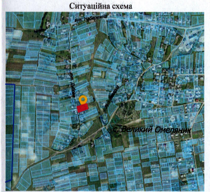
— - межа с. Великий Омеляник

Додаток до рішення міської ради № _____ від "___" _____ 20__ р.