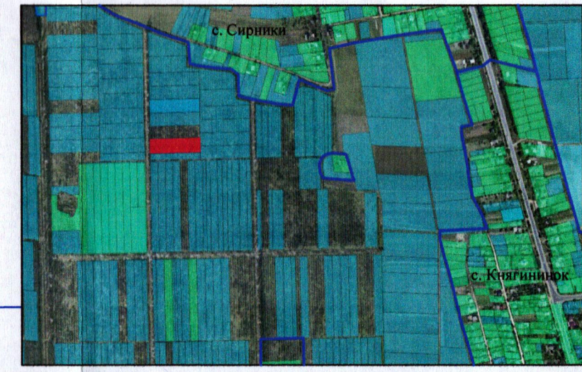
— - межа с. Княгининок, с. Сирники

Місце розташування: Волинська область, Луцький район, за межами населених пунктів Луцької міської територіальної громади (с. Сирники)