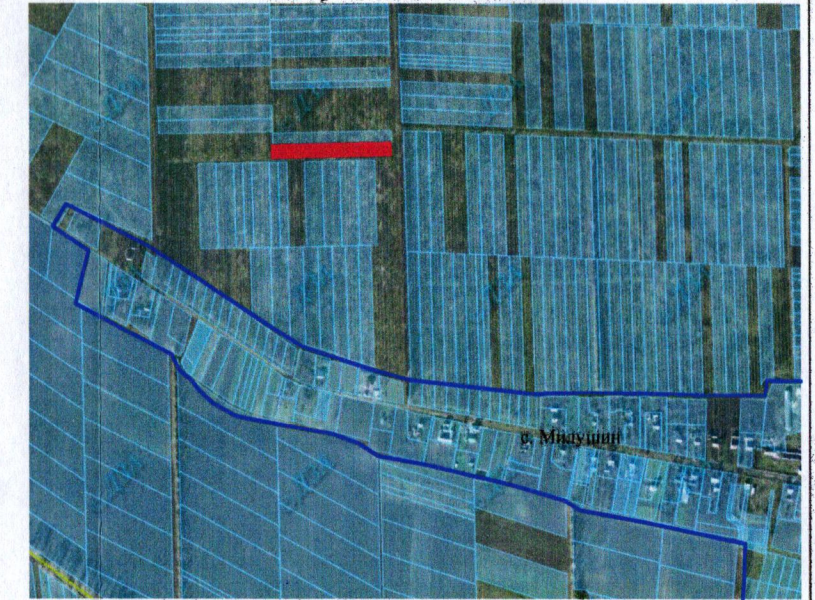
— - межа с. Милушин