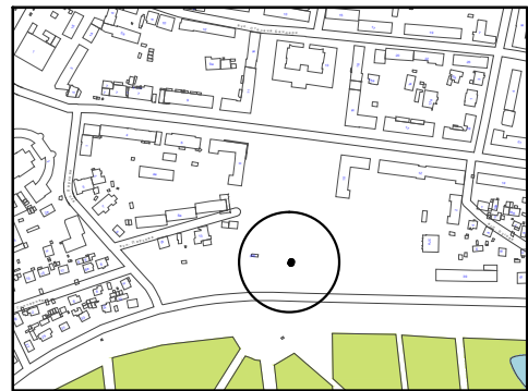
Схема розміщення тимчасової споруди, М 1:500