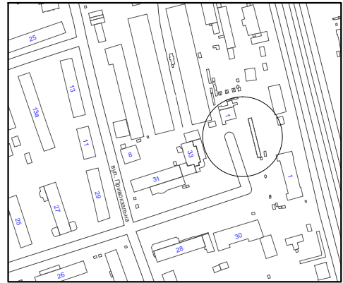
Схема розміщення тимчасової споруди, М 1:500