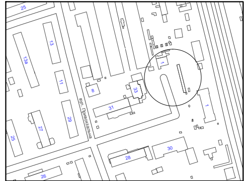
Схема розміщення тимчасової споруди, М 1:500