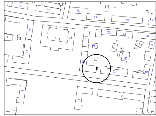
Схема розміщення тимчасових споруди, М 1:500