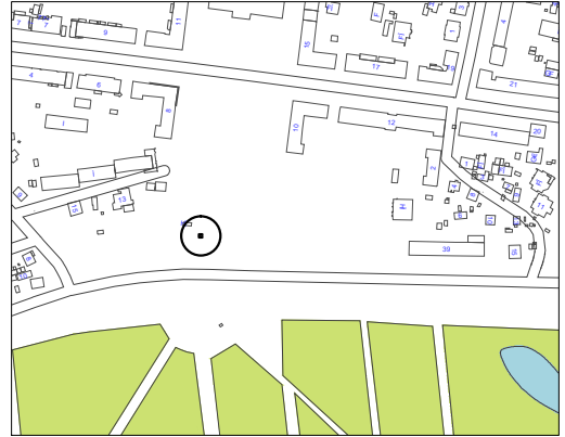
Схема розміщення тимчасової споруди, М 1:500