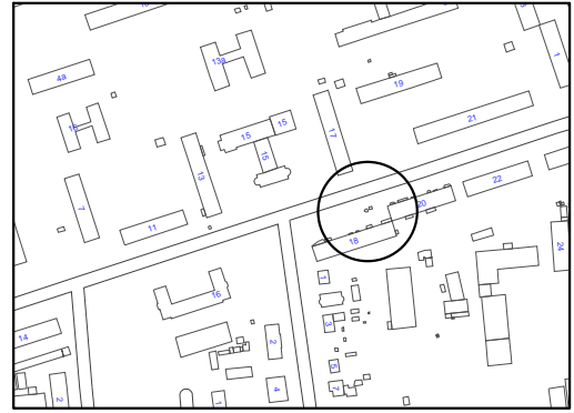
Схема розміщення тимчасової споруди, М 1:500