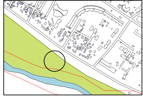
Схема розміщення тимчасової споруди, М 1:500