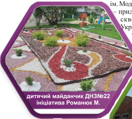
дитячий майданчик ДНЗ №22 ініціатива Романюк М.