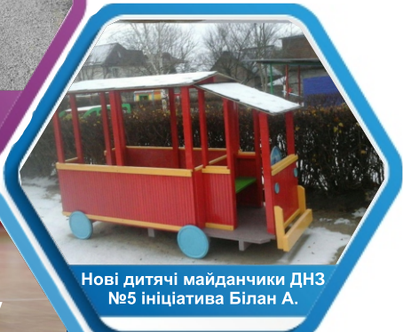
Нові дитячі майданчики ДНЗ №5 ініціатива Білан А.