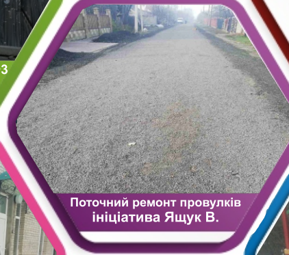
Поточний ремонт провулків ініціатива Яшук В.