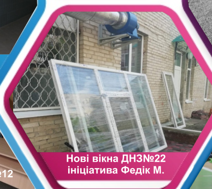
Нові вікна ДНЗ №22 ініціатива Федік М.