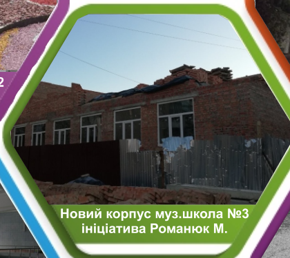
Новий корпус муз.школа №3 ініціатива Романюк М.