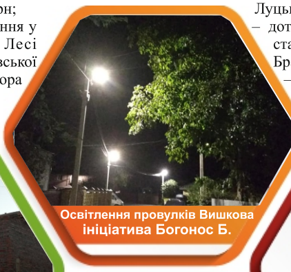
Освітлення провулків Вишкова ініціатива Богонос Б.