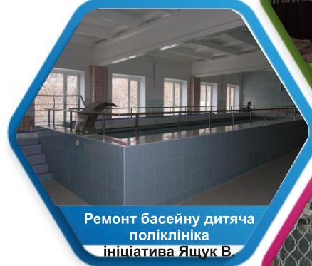
Ремонт басейну дитяча поліклініка ініціатива Яшук В.